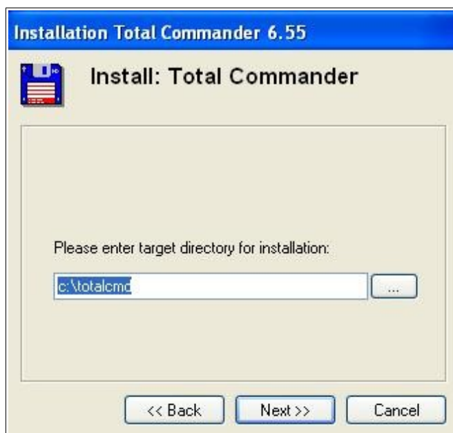
Rysunek 2. Ścieżka do instalacji programu.

W kolejnym kroku instalator zapyta nas gdzie chcemy zainstalować program. Domyślnie jest to c:\totalcmd. Po wybraniu ścieżki instalacji programu klikamy w następnych krokach na „Next”. Po zakończeniu instalacji program jest gotowy do użycia.