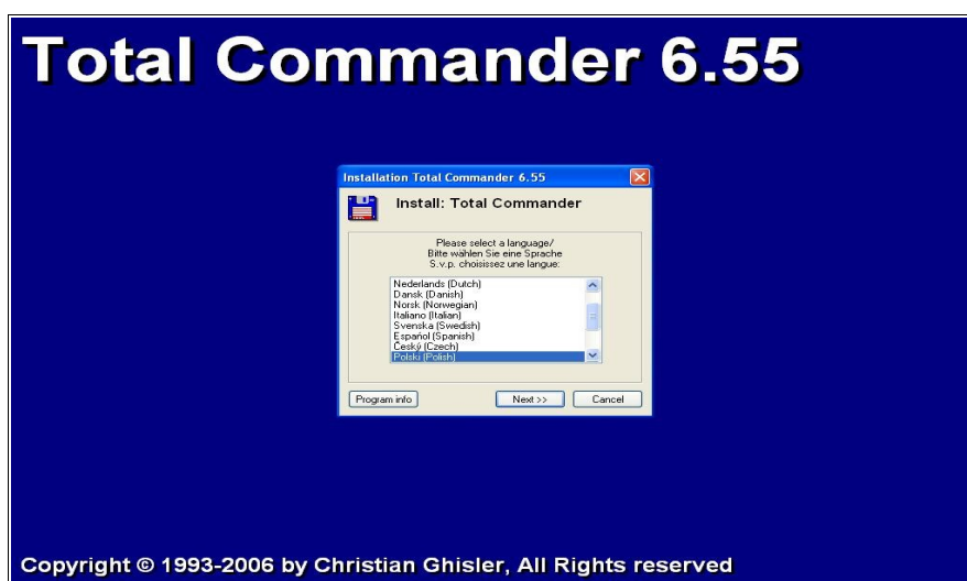
Rysunek 1. Okno powitalne instalatora Total Commander'a

Na początek ściągamy plik instalacyjny ze strony producenta, a następnie go uruchamiamy. Plik jest mały, tak więc nie powinno być problemów ze ściągnięciem go z Internetu (zajmuje około 1,6 MB).